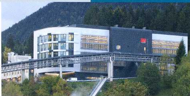
Auf Zuwachs ausgelegt: Das neue Produktionsgebäude der Ceratizit Austria in Reutte.