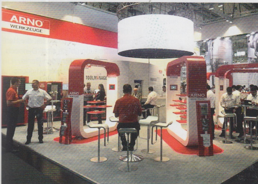
Bild: ARNO Werkzeuge zieht ein positives Fazit der diesjährigen EMO und will 2020 weiter in seine Innovationskraft investieren