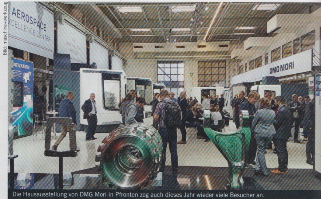
Die Hausausstellung von DMG Mori in Pfronten zog auch dieses Jahr wieder viele Besucher an.