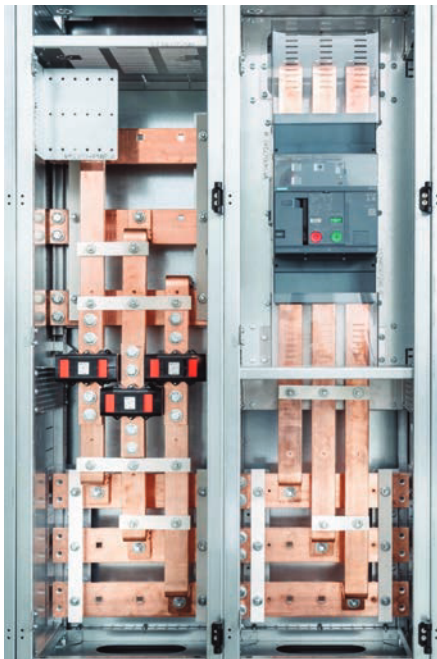
Bild | Unter den Aspekten Klimaschutz, Energieeinsparung, Nachhaltigkeit und CO 2 -Vermeidung betrachtet, sind die beiden neuen Felder zur Einspeisung erneuerbare Energien die passende Ergänzung des Systems Vamocon 1250.

kurven liegen, darf die Erzeugungsanlage nicht vom Netz getrennt werden. Für Verrechnungszwecke mit dem Netzbetreiber bedarf es schließlich einer abschnittswesisen Wandlermessung.