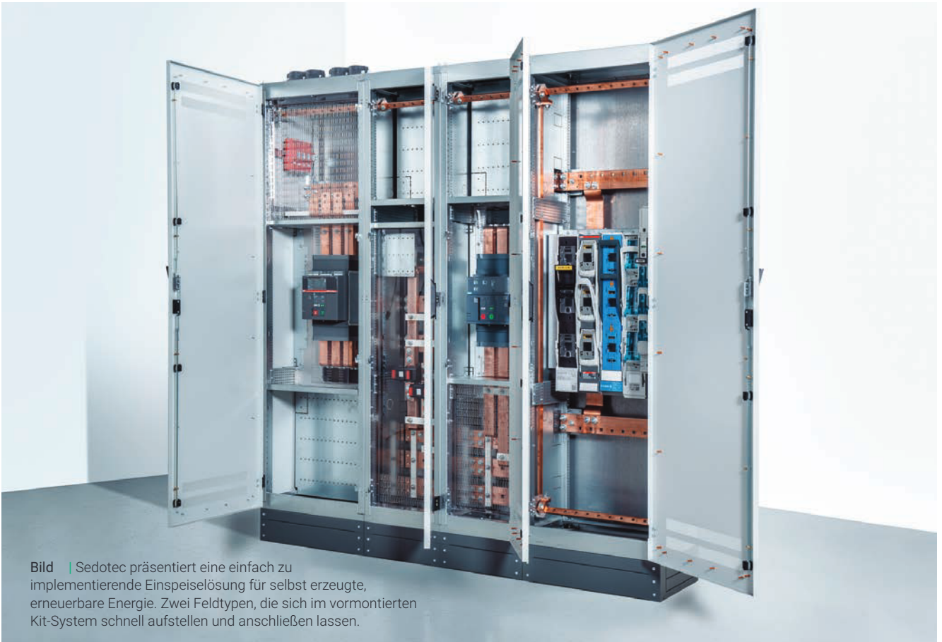
Bild | Sedotec präsentiert eine einfach zu implementierende Einspeiselösung für selbst erzeugte, erneuerbare Energie. Zwei Feldtypen, die sich im vormontierten Kit-System schnell aufstellen und anschließen lassen.

Regelungen das Thema Klimaneutralität weiterhin sehr stark im Fokus hat, hat es auch keinen Sinn abzuwarten oder zu versuchen drumherum zu kommen.