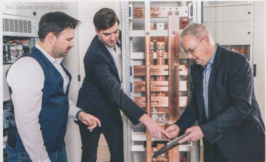
Bild 3 | Für die Produktentwicklung hat Sedotec mit Design Thinking eine neue Methode zur kreativen Bearbeitung komplexer Problem- und Aufgabenstellungen mit einem besonderen Fokus auf den beteiligten Menschen etabliert.

Seiler: Na eben deshalb. Mitarbeiter von uns arbeiten als Fachleute und ehrenamtlich seit vielen Jahren im DKE (Deutsche Kommission Elektrotechnik, ein Organ des Deutschen Instituts für Normung – DIN – und des Verbands für